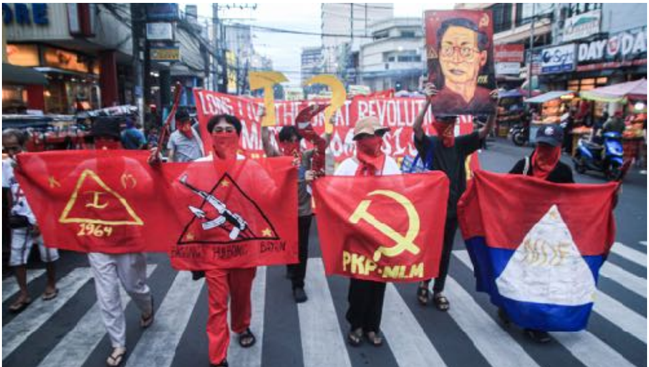
Mga myembro ng Kabataang Makabayan nagraling-iglap noong Disyembre 21, 2022

Paunang Ulat sa North Luzon noong Agosto 1970 na nagsilbing gabay sa gawain ng iba pang mga komite sa rehiyon.